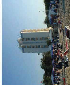
ALBERGO ESTIVO HOTEL NUOVO DIANA Lungomare Leonardo Da Vinci, 81/A Senigallia Tel. 071/7926611 Fax 071/7926711 Prenotazioni a Bologna 051/4193170