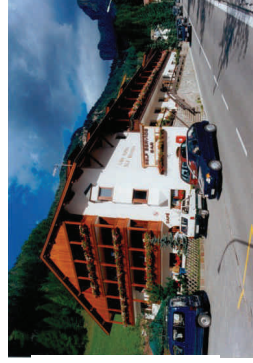
ALBERGO ESTIVO E INVERNALE CASA ALPINA Plan Di Val Gardena (BZ) Via Plan,45 - Tel.0471/795165 Prenotazioni 051/4193172