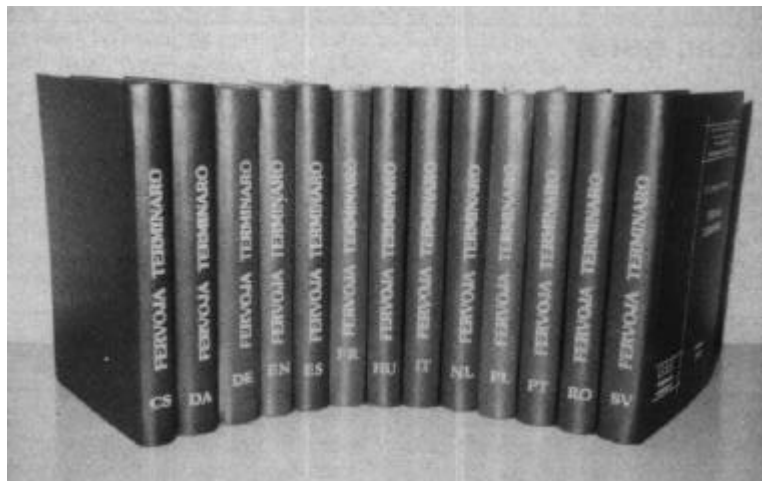
I vocabolari dei termini ferroviari ufficiali dell'UIC in quattordici lingue.

L'Esperanto, la Lingua Internazionale, che rispetta tutte le culture e tutti gli uomini, rispetta ciascuno e lo pone su un dignitoso piano di parità.