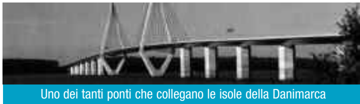
Uno dei tanti ponti che collegano le isole della Danimarca