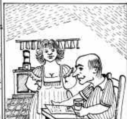
GLI OCCHI SONO... QUASI... GLI STESSI.