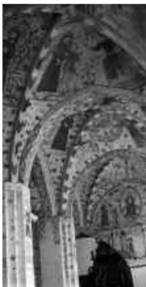
Affreschi medievali nella Chiesa di Stege

imponenza dal basso! Ai piedi della scogliera si apre una stretta spiaggia lunga 8 km., che ha una particolarità, non è fatta di sabbia, ma di gesso . Il contrasto tra il biancore lido del calcare,