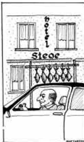
CHI CON LE ARINGHE..... HANNO FATTO I SOLDI..... NON..... LA MISERIA!!